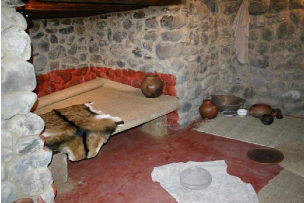
Reconstrucción del interior de una vivienda aborigen. Parque Cueva Pintada.