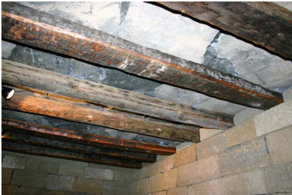
Techumbre interior de una vivienda aborigen. Parque Cueva Pintada.