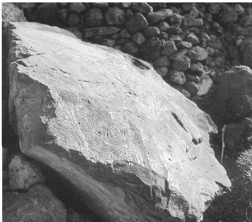
Yacimiento de Belmaco (La Palma)