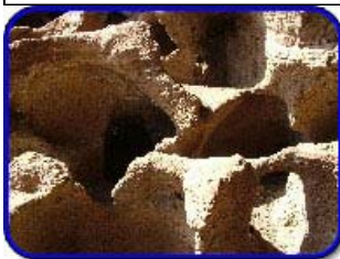
Detalle del Silo y ubicación del mismo en el barranco de Silva

Recientemente el Ayuntamiento, a través del programa europeo Interreg III-B Innovatur, ha efectuado un proyecto de Acondicionamiento Parcial del yacimiento, modernizando el equipamiento, instalando puntos de información, mejoras del aparcamiento y señalización en carretera.