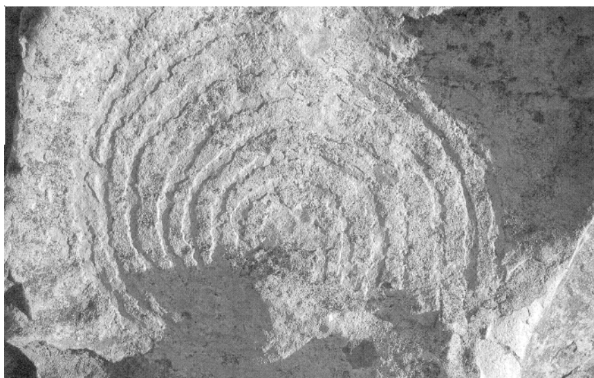
Teneguía (La Palma)