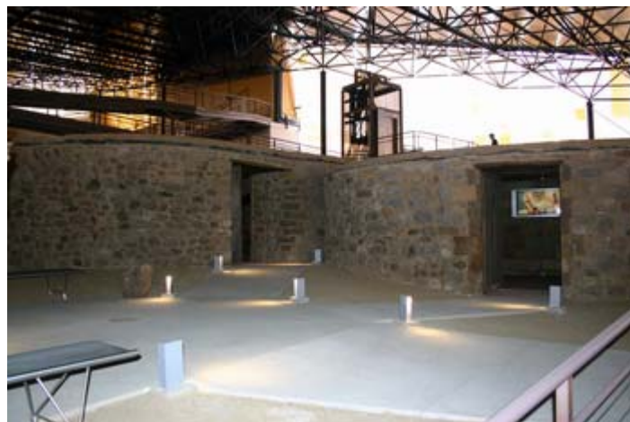
Reconstrucción de viviendas aborígenes. Parque Cueva Pintada