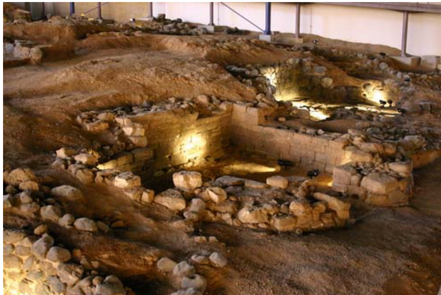
Restos de una vivienda en el Parque Arqueológico de la Cueva Pintada

El medio geográfico condiciona el hábitat aborígen y es la cueva, natural o artificial, lo más frecuente. No obstante también se encuentran casas construidas en piedra, cabañas con materiales menos duraderos y refugios, utilizados para la propia actividad pastoril.