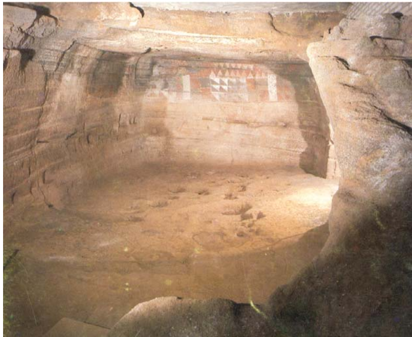
Cámara de la Cueva Pintada de Gáldar