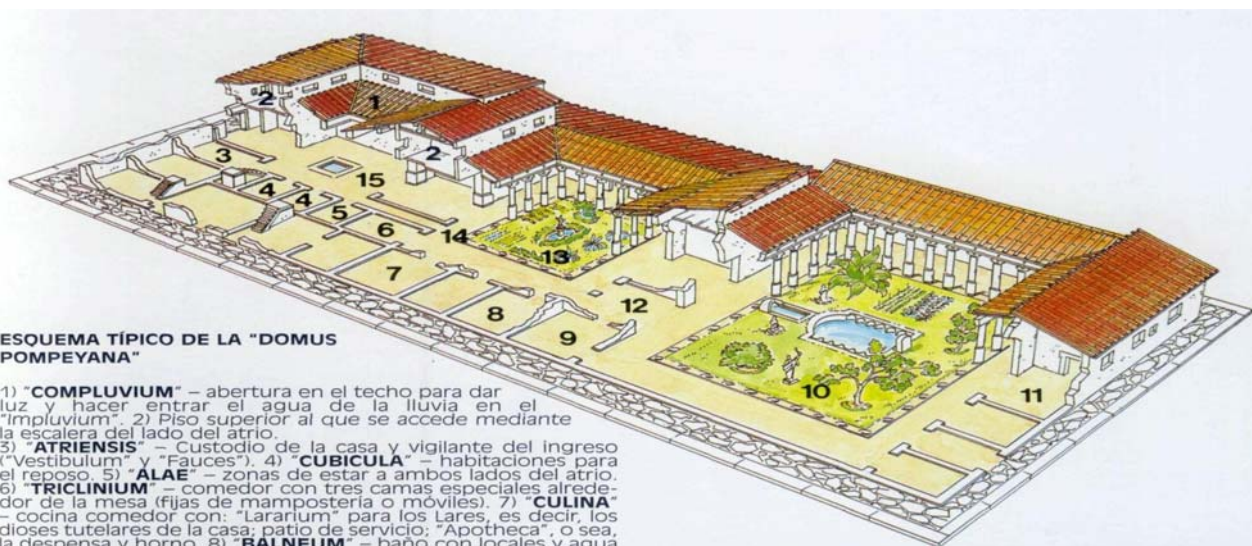
ESQUEMA TÍPICO DE LA "DOMUS POMPEYANA"

Pero un todas eran así, la mayoría de los pompeyanos habitaban en las llamadas insulas, casas de cinco o más plantas, estrechas, con altas escaleras y ventanas a la calle. Con frecuencia estos edificios con estructura de madera se derrumbaban o quemaban.